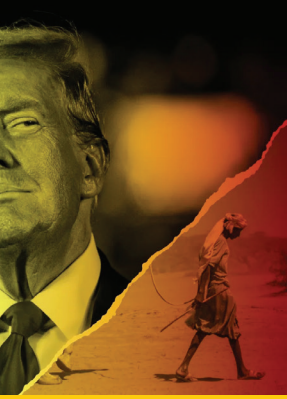
लेखक : रमेश कृ. लांजेवार (स्वतंत्र पत्रकार)

अमेरिकेतील एका रेडिओ भाष्यकाराच्या भारत आणि चीनविषयी केलेल्या आक्षेपाई वक्तव्याचा संदर्भ देणारा ध्वनिचित्रफिती त्यांनी पुढे प्रसारित केल्याने आंतरराष्ट्रीय स्तरावर नाराजी व्यक्त झाली. भारतासारख्या देशाचा अवमान करणारे शब्दप्रयोग झाल्यानंतर त्यांनी स्पष्टीकरण देत भारत महान देश असल्याचे म्हटले, मात्र या बदलत्या भूमिकेमुळे त्यांच्या