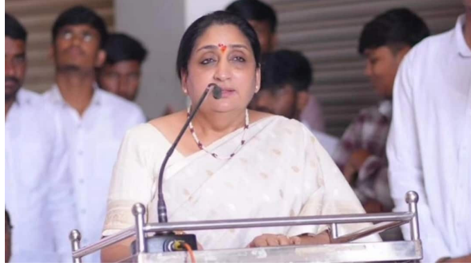
पोटनिवडणुकीसाठी उमेदवारी अर्ज दाखल करण्यास ३० मार्चपासून सुरुवात करण्यात

राज्याचे उपमुख्यमंत्री अजित पवार यांच्या निधनामुळे बारामती विधानसभा मतदार संघाची पोटनिवडणुकीची प्रक्रिया सुरु झाली असून, उपमुख्यमंत्री सुनेत्रा पवार यांच्याविरोधात बारामतीतील कोणीच निवडणूक लढविण्यासाठी धजावत नसल्याचे दिसून येत आहे. उमेदवारी अर्ज दाखल करण्यास सुरुवात झाली असून, आतापर्यंत बारामतीबाहेरील तीन जणांनी अर्ज भरले आहेत. काँग्रेसने उमेदवार उभे करण्याची तयारी दर्शविली असून, काँग्रेसच्या भूमिकेवर बारामतीतील निवडणूक बिनविरोध होणार की नाही, हे स्पष्ट होणार आहे. या