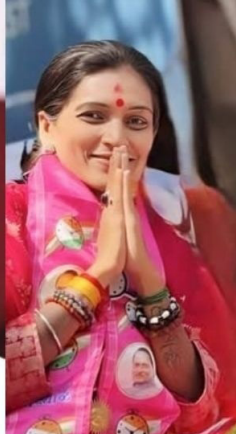
संबंधित व्यक्तींना पोलिस आणि मुख्यमंत्र्यांपर्यंत पोहोचण्यासाठी