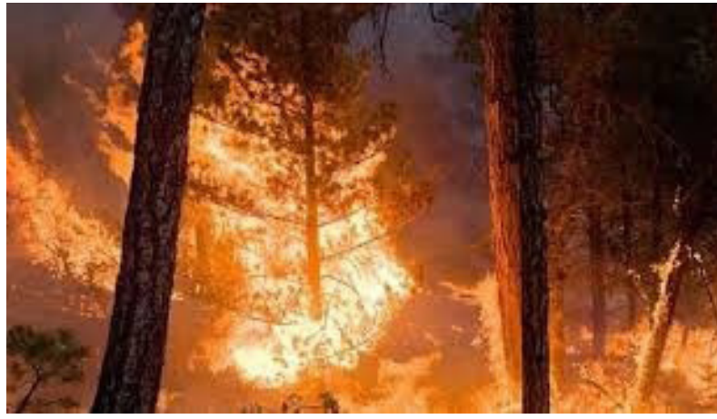
लागण्याच्या घटनांची संख्याही प्रचंड आहे. दरवर्षी उन्हाळा आला की जंगलांना आग लागण्याच्या घटना घडतात आणि त्यात बहुमोल अशी निसर्गसंपदा नष्ट होते केवळ जंगलांनाच नाही तर डोंगर, पर्वत,

लागतात. सामान्यतः सदाहरित जंगलांमध्ये आगी लागत नाही आग लागली तरी ती आपोआप विझतेही मात्र जोराने वारे वाहत असतील तर आग लवकर विझत नाही उलट ती आणखी वाढते. वनांमध्ये वाळलेले लाकूड, पाने, गवत असे अनेक घटक िष्णुपीच्या संपर्कात येताच आग भडकते. मग झाडे पेट घेतात आणि मग मोठ्या वेगाने हा वणवा सर्वत्र पसरतो. डोंगराळ भागाचा भूगोल आणि भूरचना जटिल असल्यामुळेही वणवे विझवण्यात अनेकदा अडथळे येतात. गोव्यात तेच झाले. दुर्गम परिसर आणि खडे चढण यामुळे तेथील आग विझवण्यात अडचण आल्याचे सांगितले गेले. अर्थात जंगलांना आगी लागण्याच्या या घटना नव्याही नाहीत. गेल्या काही वर्षात वणवे लागण्याचे प्रमाण ज्याप्रकारे वेगाने वाढत आहे तो एक नव्या संकटाचा इशारा आहे. नैसर्गिक कारणांमुळे जंगलांना वणवे लागण्याच्या घटना तर घडतातच पण मानवनिर्मित वणवे