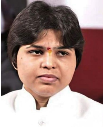
त्यांनी सांगितले की, "५ मार्च रोजी ही माहिती माझ्याकडे आली होती.